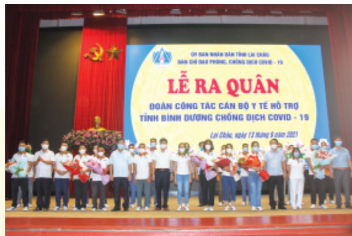
Các đồng chí lãnh đạo tỉnh chụp ảnh lưu niệm với Đoàn cán bộ tăng cường tại tỉnh Bình Dương