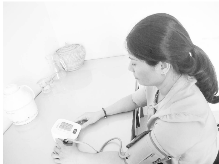
Người có nguy cơ mắc bệnh tim mạch cần được kiểm tra, theo dõi huyết áp thường xuyên

Theo thống kê của Tổ chức Y tế Thế giới, tỷ lệ tử vong do COVID-19 ở người bệnh tim mạch chiếm hơn 10%, tiếp đó là tiểu đường lớn hơn 7%. Số còn lại đứng đầu trong danh sách là người mắc bệnh hô hấp mãn tính, còn ở người bình thường là 0,9%. Điều đó cho thấy nguy cơ tử vong do COVID-19 ở người bệnh tim mạch là cao nhất và cao gấp 10 lần người bình thường. Bởi khi virus SARS-CoV-2 xâm nhập vào cơ thể sẽ kích hoạt bệnh