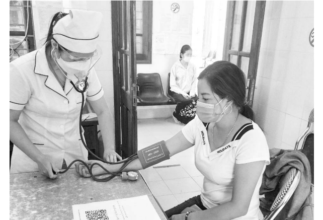
Cán bộ Trạm Y tế xã Mường Kim khám bệnh cho người dân

Để công tác phòng, chống dịch trên địa bàn xã đạt hiệu quả, những ngày này đều đặn hai buổi sáng, chiều lực lượng cán bộ y tế trạm và các thành viên tổ giám sát dịch bệnh