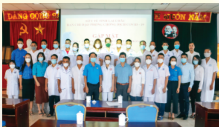
Lãnh đạo Sở Y tế, Liên đoàn Lao động tỉnh tặng quà, động viên, chia tay Đoàn cán bộ hỗ trợ tỉnh Bình Dương