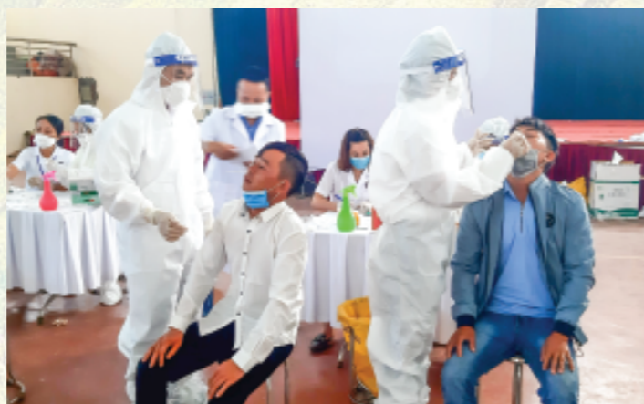
Cán bộ Trung tâm Kiểm soát bệnh tật tỉnh lấy mẫu test nhanh Covid-19 tại tuần hỗ trợ, kết nối việc làm cho người lao động