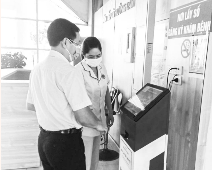
BVĐK tỉnh ứng dụng CNTT trong KCB để nâng cao chỉ số cải cách hành chính

việc thành lập Ban chỉ đạo và tổ giúp việc ban chỉ đạo CCHC Ngành Y tế giai đoạn 2020-2025; Quyết định số 2362/QĐBCĐ-SYT, ngày 31/12/2020 của Sở Y tế về việc ban hành Quy chế hoạt động của Ban chỉ đạo CCHC Sở Y tế. Ban hành Đề án “Đẩy mạnh cải cách hành chính, cải thiện môi trường đầu tư kinh doanh, nâng cao chỉ số năng lực cạnh tranh cấp tỉnh giai đoạn 2021-2025, định hướng đến năm 2030”; Kế hoạch số 06/KH-SYT, ngày 12/01/2021 của Sở Y tế triển khai thực hiện Nghị quyết số 02/NQ-CP ngày 01/01/2021 của Chính phủ về tiếp tục thực hiện những nhiệm vụ, giải pháp chủ yếu cải thiện môi trường kinh doanh, nâng cao năng lực cạnh tranh năm 2021 của Sở Y tế; Kế hoạch số 23/KH-SYT, ngày 02/02/2021 về Kiểm tra công tác CCHC năm 2021; Kế hoạch số 24/KH-SYT, ngày