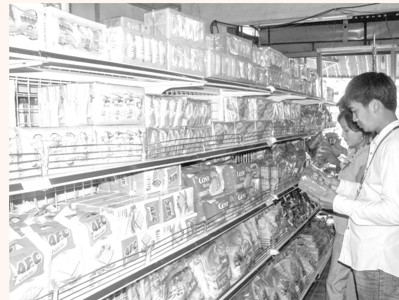
Người tiêu dùng hãy biết cách lựa chọn những sản phẩm bánh kẹo, nước giải khát đảm bảo ATVSTP

T ết Trung thu là lúc mà sản phẩm bánh kẹo, nước giải khát, hoa quả được tiêu thụ mạnh. Do đó, việc sản xuất, lưu thông và phân phối các mặt hàng này trên thị trường cũng tăng đột biến.