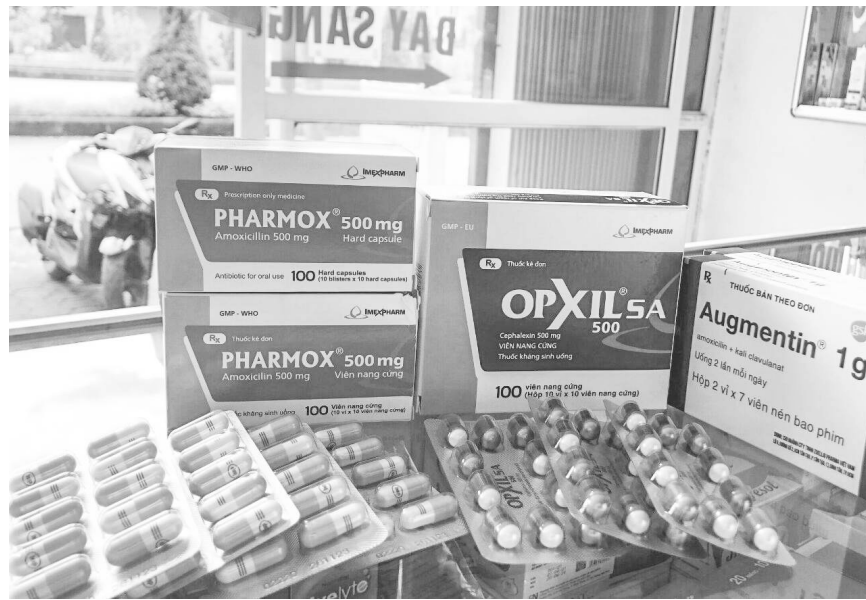
Phụ nữ mang thai sử dụng thuốc kháng sinh cần tuân thủ tuyệt đối chỉ định của bác sĩ

kháng sinh còn có thể ảnh hưởng xấu đến sự phát triển thể chất và trí tuệ của trẻ, từ khi còn là bào thai đến lúc chào đời.