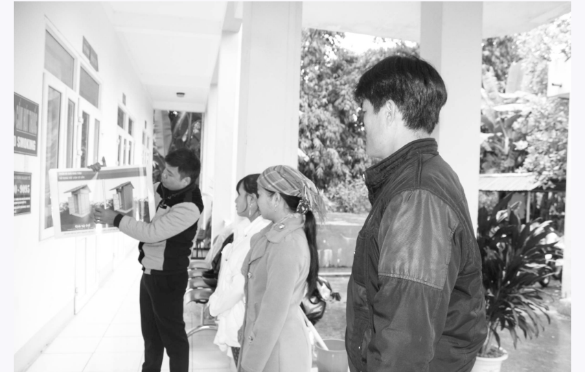
Cán bộ TTYT huyện Tam Đường tuyên truyền hướng dẫn người dân xây dựng nhà tiêu hợp vệ sinh

Kết quả sau 5 năm triển khai, từ năm 2016 đến nay, Ngành Y tế đã tổ chức 86 lớp tập huấn Truyền thông về thay đổi hành vi vệ sinh và phát triển thị trường vệ sinh cho 2.795 người; thu