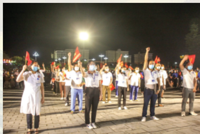
Đoàn cán bộ tăng cường TP HCM (đợt 2) hô khẩu hiệu quyết tâm chiến thắng đại dịch Covid-19 tại Lễ ra quân