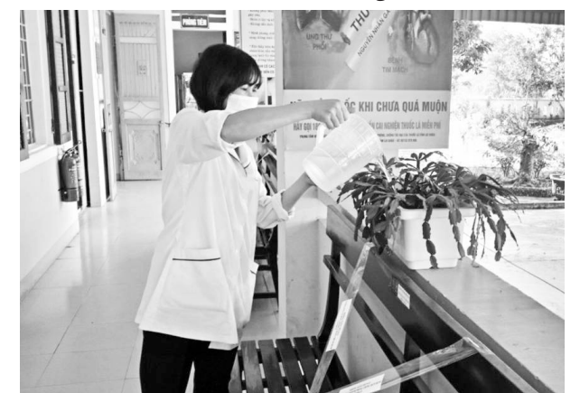
Cán bộ Trạm Y tế xã Bình Lư chăm sóc cây cảnh sau mỗi buổi làm việc

Đến Trạm Y tế xã Bình Lư, huyện Tam Đường, điều mà ai cũng nhận thấy đó là trạm có một khuôn viên sạch đẹp, khoa học, phù hợp với môi trường của đơn vị y tế. Từ đường đi, nhà gửi xe, ghế ngồi cho đến phòng chờ đều được bố trí khá thuận lợi. Các phòng điều