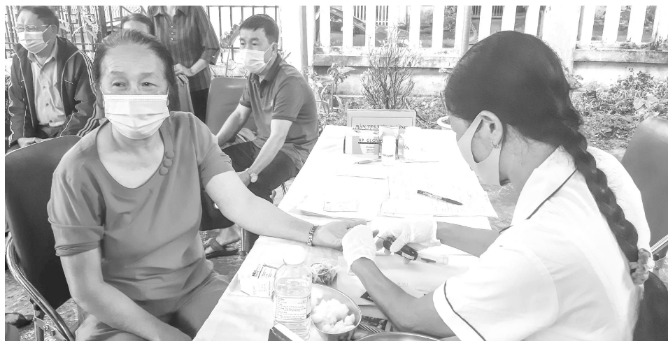
Cán bộ trung tâm Y tế Thành Phố kiểm tra tiểu đường cho người cao tuổi tại Trạm Y tế phường Đoàn Kết

K hi tuổi càng cao con người thường phải đối mặt với các vấn đề về sức khỏe cũng như tâm lý. Vì vậy, việc giữ gìn sức khỏe và phòng tránh bệnh tật cho người cao tuổi là cực kỳ quan trọng trong bối cảnh xã hội đang có xu