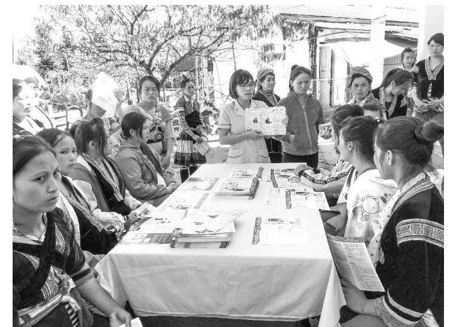
Cán bộ trạm Y tế xã Đào Sơn - Phong Thổ tư vấn chăm sóc sức khỏe sinh sản cho phụ nữ trong độ tuổi sinh đẻ.

Nhiều năm trở lại đây, hoạt động kỷ niệm Ngày thành lập Hội liên hiệp Phụ nữ Việt Nam đã trở nên khá phổ biến và vào mỗi dịp này, các hoạt động tôn vinh phụ nữ lại càng được nhắc đến nhiều. Tuy nhiên, khía cạnh cơ bản vẫn là ở sự bình đẳng đích thực, nghĩa là các giới được phát huy và phát triển trong khả năng và tiềm năng của mỗi giới mà không phải ở việc yêu cầu phải thế này hay phải thế kia. Điều hy vọng là qua mỗi đợt lễ này, người ta sẽ tìm cách thay đổi những định kiến giới và chuẩn mực văn hóa làm hạn chế cơ hội của các giới nói chung trong đó có phụ nữ nói riêng để cùng nhau phấn đấu cho một xã hội công bằng với cả nam và nữ.