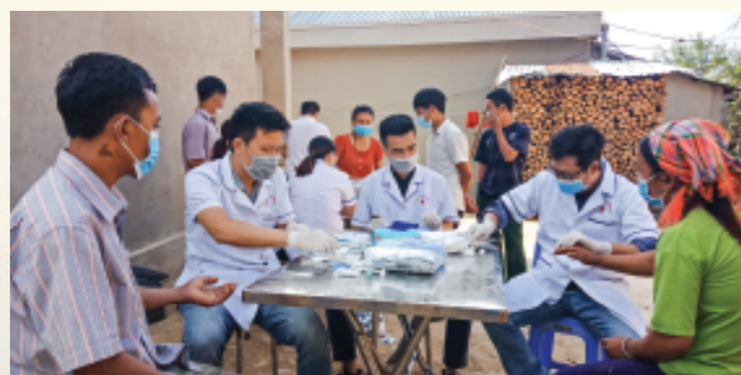
Cán bộ Viện sốt rét - KST - CT hỗ trợ làm test nhanh tìm ký sinh trùng sốt rét cho người dân xã Thu Lũm (Mường Tè)