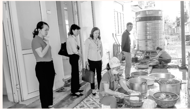
Đoàn Thanh kiểm tra liên ngành an toàn vệ sinh thực phẩm tỉnh kiểm tra bếp ăn tập thể tại huyện Tân Uyên

Chính vì vậy, vấn đề an toàn thực phẩm có tầm quan trọng đặc biệt đối với lứa tuổi học sinh vì cơ thể của các cháu phát triển chưa hoàn thiện, dễ bị tổn thương đến các cơ quan nội tạng, dễ bị ngộ độc cấp tính hoặc các bệnh mãn tính về sau. Để đảm bảo an toàn thực phẩm (ATTP) trong các trường học, Bộ Y tế đã ban hành các văn bản quy định về điều kiện ATTP đối với các cơ sở kinh doanh dịch vụ ăn uống nói chung trong đó có loại hình bếp ăn tập thể. Trong những năm qua, ngành Giáo dục Đào tạo Lai Châu đã nỗ lực trong xây dựng các bếp ăn theo quy định của Bộ Y tế, như xây dựng cơ sở vật chất, mua sắm trang thiết bị đảm bảo an toàn, thiết kế phù hợp, bố trí các khu vực theo quy trình một chiều... Phối hợp với ngành Y tế cung cấp kiến