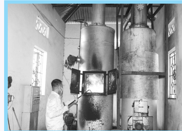
Nhân viên Bệnh viện Đa khoa tỉnh xử lý rác thải nhựa để bảo vệ môi trường

thiết bị, đồ dùng sinh hoạt thường ngày trong gia đình, đến văn phòng phẩm tại nơi làm việc, các bao bì, các thiết bị ngành Y tế, nhãn mác sản phẩm tại cửa hàng, siêu thị, thiết bị giải trí, nghe nhìn như băng đài, đầu đĩa, tivi, quần áo mặc hàng ngày được dệt từ sợi nhựa tổng hợp... Nhựa còn tồn tại ở dạng siêu nhỏ, mà người ta hay gọi là hạt vi nhựa, có mặt trong sản phẩm kem đánh răng, sữa rửa mặt, dầu gội đầu... Dù tồn tại dưới dạng nào, là những hạt nhựa siêu nhỏ, hay gom thành từng khối, thì chất thải nhựa có tác hại khôn lường đến môi trường tự nhiên.