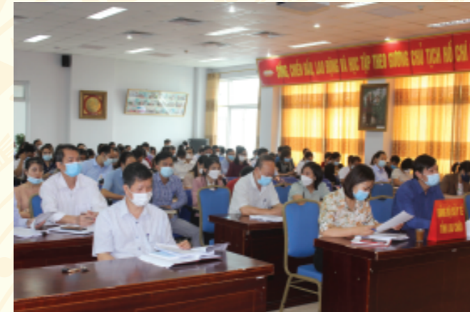
Quang cảnh Hội nghị trực tuyến tại điểm cầu Đảng bộ Sở y tế

Ảnh bìa 1. Đồng chí Tổng Thanh Hải - UVBTV, Phó Chủ tịch thường trực UBND tỉnh, kiểm tra công tác phòng, chống dịch Covid-19 tại khu cách ly số 1 huyện Tam Đường