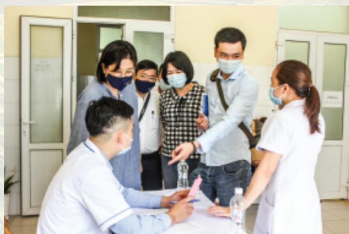
Đoàn chuyên gia của Tổ chức Y tế thế giới - Văn phòng Tiêm chủng mở rộng miền Bắc thăm, hướng dẫn, hỗ trợ huyện Mường Tè trong công tác tiêm chủng và tiêm phòng vắc xin Covid -19