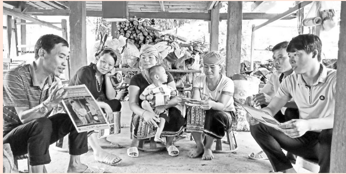
Cán bộ trạm y tế xã Nậm Tăm (Sìn Hồ) tuyên truyền cho Nhân dân xây dựng và sử dụng nhà tiêu hợp vệ sinh

Nâng cao tỷ lệ hộ gia đình sử dụng nhà tiêu hợp vệ sinh và rửa tay với xà phòng còn gặp rất nhiều khó khăn, đặc biệt với các tỉnh vùng cao. Để cải thiện điều này, việc nâng cao nhận thức, truyền thông thay đổi hành vi cho người dân trên địa bàn tỉnh rất quan trọng, cần được triển khai đa dạng, thường xuyên, liên tục và có sự đồng thuận trong Nhân dân.