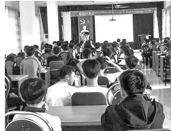
Cán bộ Trung tâm Kiểm soát bệnh tật tỉnh tổ chức ngoại khóa chủ đề chăm sóc sức khỏe sinh sản vị thành niên cho học sinh trường THCS Tân Phong, Tp Lai Châu.