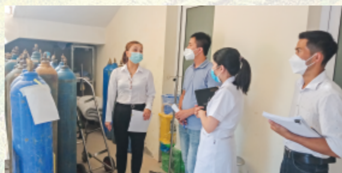
Đoàn Kiểm tra Sở Y tế kiểm tra hệ thống ô xy dự phòng để đảm bảo công tác phòng, chống dịch tại huyện Tân Uyên