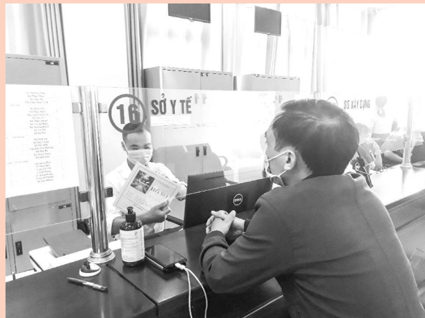
Người dân đến nộp hồ sơ làm thủ tục hành chính của Sở Y tế tại TT hành chính công

Thủ tục Cấp lại Giấy chứng nhận là lương y: Cắt giảm thành phần hồ sơ là "02 phong bì có dán tem và ghi rõ họ tên, địa chỉ