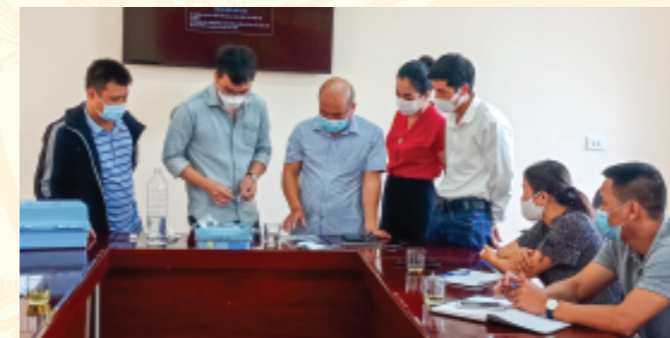
Cán bộ Viện Sức khỏe nghề nghiệp và Môi trường hướng dẫn cán bộ TT Kiểm soát bệnh tật, trung tâm Nước sạch và VSMT sử dụng máy đo hiện trường kiểm tra chất lượng nước (độ đục, Clo dư)