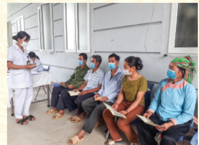
Cán bộ Trạm Y tế xã Giang Ma (Tam Đường) tuyên truyền cách phòng, chống dịch bệnh cho người dân