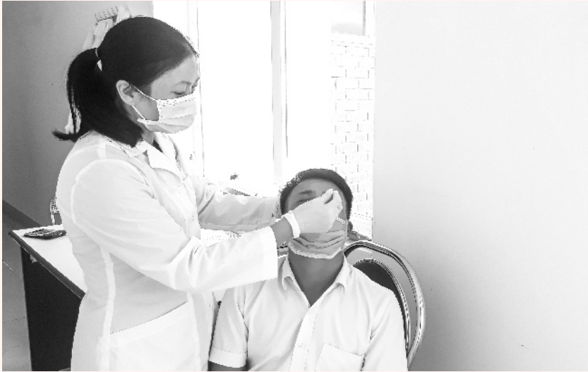
Cán bộ Trung tâm Kiểm soát bệnh tật tỉnh lấy mẫu xét nghiệm Covid-19 cho người dân

V ới vai trò nòng cốt trong lĩnh vực y tế, thời gian qua, Sở Y tế Lai Châu đã tích cực, chủ động tham mưu cho tỉnh, đồng thời đã triển khai đồng bộ nhiều giải pháp để thực hiện hiệu quả các biện pháp phòng, chống dịch, góp phần đẩy lùi dịch bệnh COVID-19, bảo vệ sức khỏe cho Nhân dân.