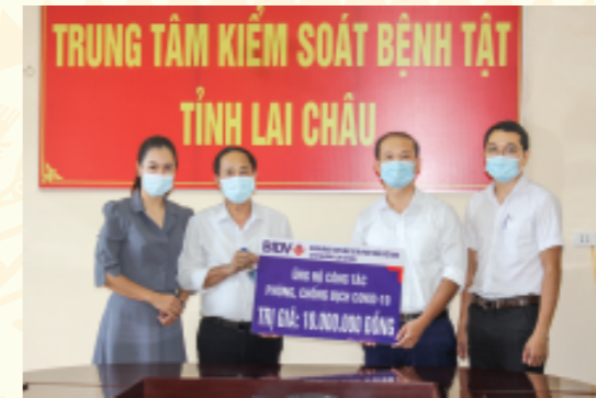
Lãnh đạo BIDV Lai Châu trao tặng quà cho cán bộ, y, bác sỹ phòng chống dịch Covid-19 của Trung tâm Kiểm soát bệnh tật

Ảnh bìa 1. Lãnh đạo Tỉnh ủy, HĐND, UBND tỉnh chia tay Đoàn trước khi lên đường nhận nhiệm vụ