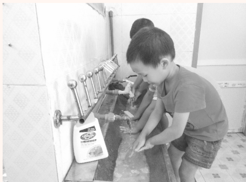
Các cháu Trường mầm non Tân Phong rửa tay thường xuyên bằng xà phòng để phòng, chống dịch Covid-19

Mỗi ngày chúng ta đều phải tiếp xúc, với những đồ vật có nguy cơ chứa các tác nhân gây bệnh (virus, vi khuẩn, nấm...) mà không hề hay