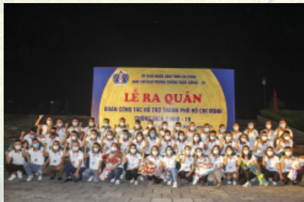
Đoàn Lai Châu thể hiện sự quyết tâm trước khi lên đường thực hiện nhiệm vụ