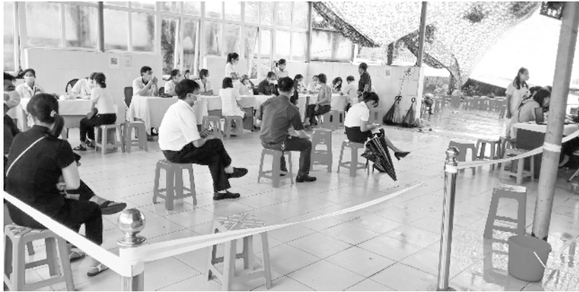
Đảm bảo an toàn, giữ khoảng cách khi tiêm phòng Covid-19

Tuy nhiên, trong mấy ngày gần đây một số cơ quan thông tin đại chúng đã phản ánh việc tổ chức triển khai tiêm chủng của một số đơn vị chưa đảm bảo đúng hướng dẫn của Bộ Y tế; Ban chỉ đạo Chiến dịch triển khai tiêm chủng vắc xin phòng COVID-