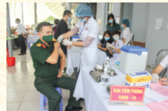
Cán bộ Trung tâm kiểm soát bệnh tật tỉnh tiêm Vắc xin phòng Covid-19 cho lực lượng vũ trang