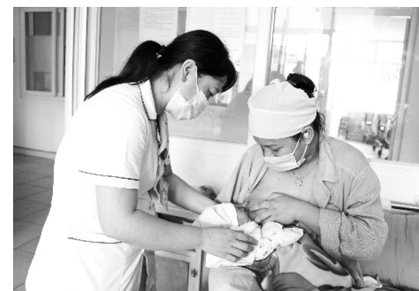
Cán bộ y tế hướng dẫn bà mẹ cách cho con bú

Sữa mẹ là nguồn dinh dưỡng quý giá cho trẻ sơ sinh và trẻ nhỏ, trong sữa mẹ có chứa nhiều kháng thể giúp phòng ngừa các bệnh nhiễm khuẩn, giúp trẻ phát triển toàn diện về thể chất lẫn tinh thần. Theo khuyến cáo của Tổ chức Y tế thế giới (WHO), các bà mẹ nên cho trẻ bú sữa mẹ trong vòng 1 giờ sau sinh, bú mẹ hoàn toàn trong 6 tháng đầu, không cho trẻ ăn thêm bất cứ thức ăn nào khác ngoài sữa mẹ và tiếp tục cho bú sữa mẹ cho tới khi trẻ được 2 tuổi hoặc lâu hơn. Cho trẻ bú sớm trong giờ đầu và bú mẹ hoàn toàn được nhân viên y tế tuyên truyền, hướng dẫn cho 100% các bà mẹ áp dụng. Bảo đảm cho trẻ sơ sinh bú hoàn toàn bằng sữa mẹ trước khi xuất viện và không quảng cáo các sản phẩm thay thế sữa mẹ. Ngay sau sinh, các bà mẹ đều được nhân viên y tế hướng dẫn để cho em bé được bú ngay giờ