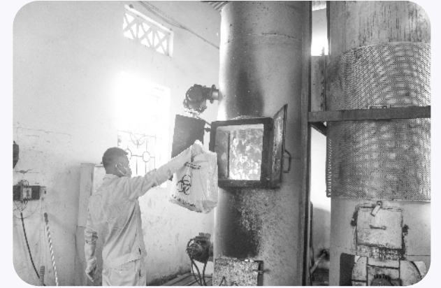
Nhân viên bệnh viện Đa khoa tỉnh xử lý rác thải nguy hại tại lò đốt

C hất thải y tế nguy hại là chất thải y tế chứa yếu tố lây nhiễm hoặc có đặc tính nguy hại khác vượt ngưỡng chất thải nguy hại, có các thành phần như: Máu, dịch cơ thể, chất bài tiết, các bộ phận cơ thể, cơ quan, bơm, kim tiêm, vật sắc nhọn, dược phẩm, hoá chất, chất phóng xạ... Chất thải y tế nguy hại có 2 loại: Chất thải rắn và chất thải lỏng gồm chất thải lây nhiễm và chất thải nguy hại không lây nhiễm. Hệ thống cơ sở y tế có phát sinh chất thải y tế trên địa bàn tỉnh hiện có: 11 bệnh viện công lập (03 bệnh viện tuyến tỉnh; 08 Trung tâm Y tế tuyến huyện, thành phố); 02 cơ sở y tế thuộc hệ y tế dự phòng; 04 Phòng khám đa khoa khu vực, 103 Trạm y tế xã, phường, thị trấn và 50 cơ sở y tế ngoài công lập. Chất thải y tế nguy hại phát sinh nếu không được xử lý hoặc xử lý không đúng quy trình kỹ thuật sẽ là nguồn gây ô nhiễm môi trường, ảnh hưởng trực tiếp đến sức khỏe cán bộ y tế và cộng đồng dân cư và môi trường xung quanh.