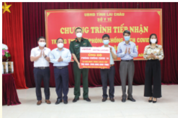
Lãnh đạo tỉnh, ngành Y tế tiếp nhận trang thiết bị do Viettel Lai Châu tài trợ.