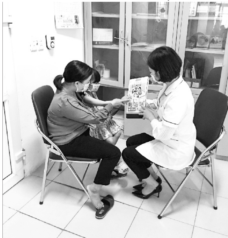
Cán bộ Trung tâm Y tế Tân Uyên tư vấn dinh dưỡng cho bà mẹ đang nuôi con nhỏ dưới 5 tuổi

Những năm gần đây, công tác phòng, chống suy dinh dưỡng trẻ em (PCSDDTTE) dưới 5 tuổi ở huyện Tân Uyên đạt được những kết quả đáng ghi nhận. Tỷ lệ trẻ em dưới 5 tuổi bị suy dinh dưỡng giảm dần qua các năm. Trong 6 tháng đầu năm 2021, tỷ lệ trẻ em dưới 5 tuổi suy dinh dưỡng giảm còn 19,69% (giảm 1,3%) so với cùng kỳ năm 2020. Tỷ lệ suy dinh dưỡng bào thai cũng giảm dần qua các năm. Đó là kết quả đáng ghi nhận đối với một huyện mà đời sống của Nhân dân còn gặp nhiều khó khăn, tỷ lệ hộ nghèo còn cao, trình độ dân trí còn hạn chế. Để đạt được kết quả trên phải kể đến sự cố gắng của đội ngũ cán bộ y tế và sự phối hợp của các ban, ngành trong