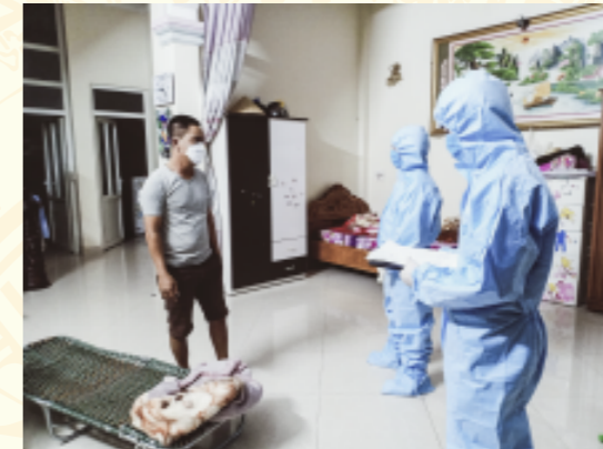
Tổ Điều tra phòng, chống Covid-19, trung tâm Kiểm soát bệnh tật tỉnh kiểm tra việc thực hiện cách ly y tế tại nhà trên địa bàn thành phố