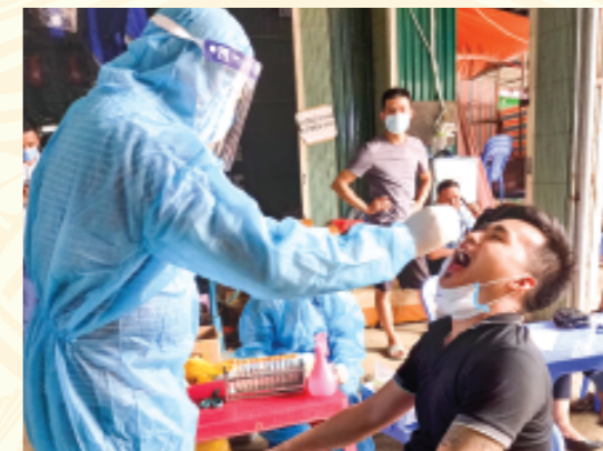
Cán bộ Trung tâm Kiểm soát bệnh tật tỉnh lấy mẫu xét nghiệm PCR sàng lọc cộng đồng phòng, chống Covid-19 tại Huyện Tân Uyên