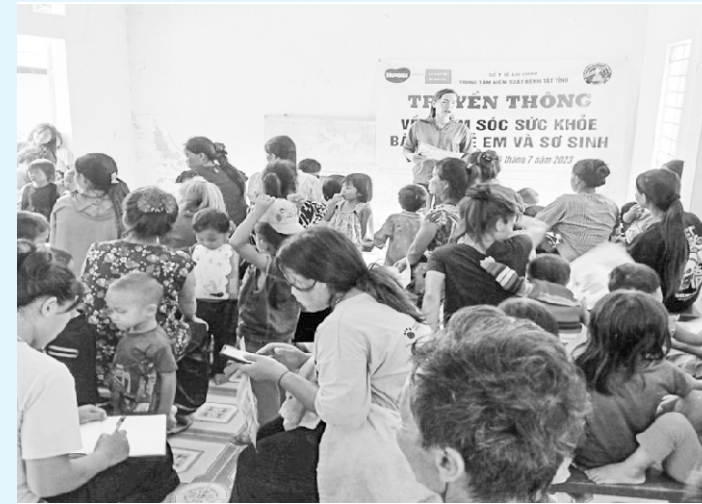
Cán bộ Trung tâm KSBT tỉnh truyền thông về chăm sóc sức khỏe sinh sản cho phụ nữ trong độ tuổi sinh đẻ từ 15 - 49 tuổi tại xã Vàng San huyện Mường Tè

Điều kiện kinh tế, nhận thức của người dân, giao thông khó khăn, tập tục đẻ tại nhà không có nhân viên y tế chăm sóc, rào cản về ngôn ngữ, là những yếu tố ảnh hưởng rất lớn đến chất lượng làm mẹ an toàn, tình hình tử vong mẹ tại tỉnh Lai Châu còn cao hơn nhiều so với vùng đồng bằng. Bên cạnh đó, năng lực chuyên môn của đội ngũ nhân viên y tế, đặc biệt là y tế thôn, bản, cô đỡ thôn bản còn hạn chế, đã phần nào ảnh hưởng trực tiếp đến công tác chăm sóc sức khỏe sinh sản (CSSKSS).