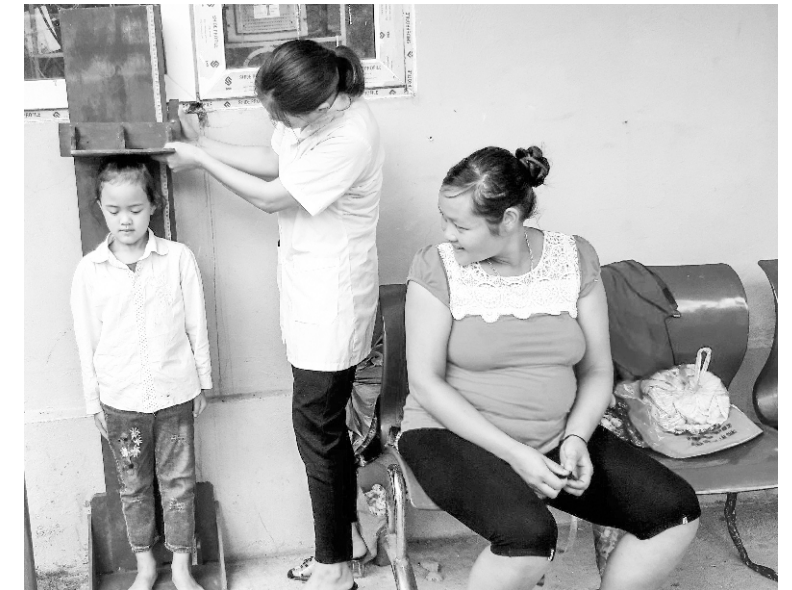
Đo chiều cao cho các em học sinh tại xã Can Hồ, huyện Mường Tè

Qua thống kê, tỉnh Lai Châu hiện có tổng số 337 trường học, trong đó 268 trường có phòng Y tế riêng; 173 trường có cán bộ YTTH, cán bộ kiêm nhiệm là 164 (không phải nhân viên qua đào tạo Y tế). Hiện nay, mạng lưới YTTH đã được củng cố ở các tuyến. Ở tuyến tỉnh, Sở Y tế, Sở Giáo dục và Đào tạo đã bố trí cán bộ các phòng thực hiện công tác YTTH. Trung tâm Kiểm soát bệnh tật tỉnh cũng bố trí cán bộ phối hợp với chuyên viên của Sở Giáo dục và Đào tạo chịu trách nhiệm tham mưu và tổ chức công tác YTTH. Tại tuyến huyện đã bố trí cán bộ Phòng Giáo dục và Đào tạo, Trung tâm Y tế phối hợp triển khai YTTH trên địa bàn. 100% Trạm Y tế xã đã cử cán bộ thực hiện công tác YTTH; 318 trường có Ban chăm sóc sức khỏe học sinh, bố trí cán bộ y tế chuyên trách hoặc kiêm nhiệm YTTH. Bên cạnh