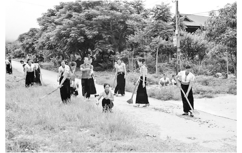
Hội Phụ nữ xã Nậm Hàng vệ sinh môi trường, phòng chống dịch bệnh

Nhằm nâng cao nhận thức của Nhân dân về vệ sinh môi trường, thực hiện thói quen vệ sinh cá nhân, góp phần nâng cao chất lượng cuộc sống, UBND xã đã đẩy mạnh công tác truyền thông thông qua đội ngũ cộng tác viên y tế tại cơ sở; tuyên truyền cổ động trực quan bằng băng zôn, khẩu hiệu; tuyên truyền lồng ghép trong các đợt sinh hoạt của Hội Phụ nữ, Hội Nông dân, Hội Cựu chiến binh, Đoàn Thanh niên, Mặt trận tổ quốc với các nội dung như: Không vứt rác, đổ chất thải bừa bãi, sử dụng nguồn nước sạch, bảo đảm ATVSTP bằng cách sử dụng nguồn thực phẩm bảo đảm chất lượng, bảo vệ nguồn nước, thực hiện các thói quen hợp vệ sinh. Trường hợp vi phạm vệ sinh môi trường, đổ rác không đúng nơi quy định đều bị nhắc nhở kịp thời.