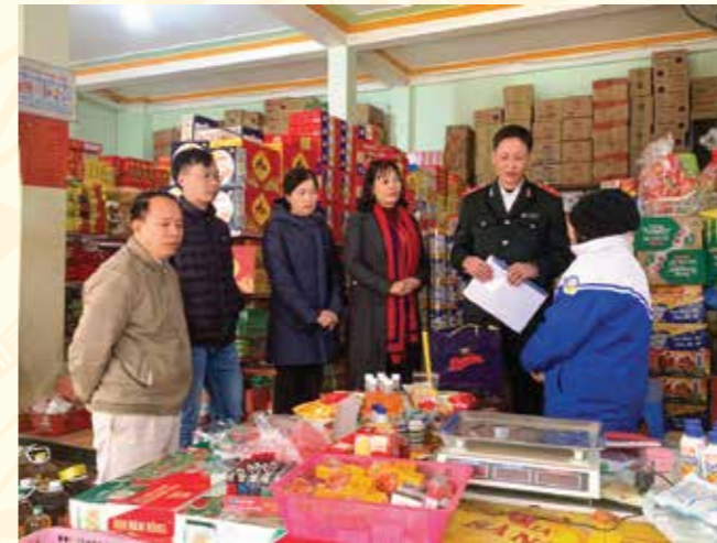
Đoàn Kiểm tra liên ngành về ATTP tỉnh kiểm tra việc chấp hành các quy định của pháp luật về ATTP trong dịp Tết Nguyên đán Giáp Thìn và mùa Lễ hội xuân 2024 tại huyện Phong Thổ