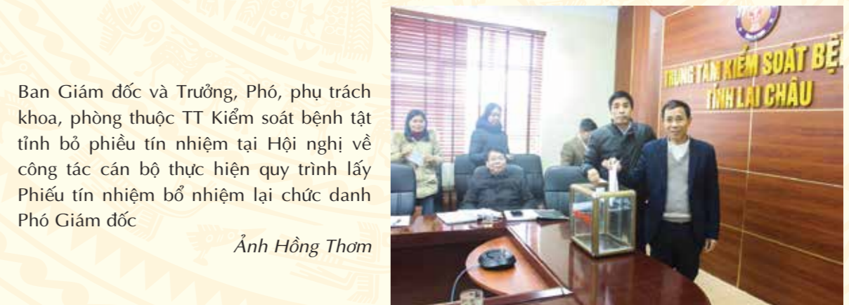
Ban Giám đốc và Trưởng, Phó, phụ trách khoa, phòng thuộc TT Kiểm soát bệnh tật tỉnh bỏ phiếu tín nhiệm tại Hội nghị về công tác cán bộ thực hiện quy trình lấy Phiếu tín nhiệm bổ nhiệm lại chức danh Phó Giám đốc