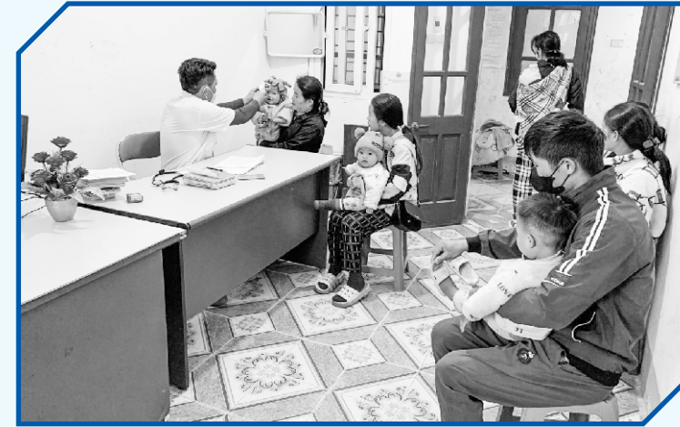
Cán bộ Phòng Khám Đa Khoa khu vực Đào San khám sàng lọc cho trẻ trước tiêm chủng

C úng tôi đến phòng khám Đa khoa khu vực (PKĐKKV) Đào San, huyện Phong Thổ vào một ngày nắng ấm của tiết trời vào xuân, trên sườn đồi những cành đào, cành mận đang thi nhau đâm chồi, nảy lộc. Ngoài đường, dòng người tấp nập ngược, xuôi nhưng đâu đó vẫn có những người làm việc không quản ngày đêm, chỉ mong mọi người được chăm sóc sức khỏe một cách tốt nhất, tạo niềm tin yêu cho những người bệnh khi đến đây.