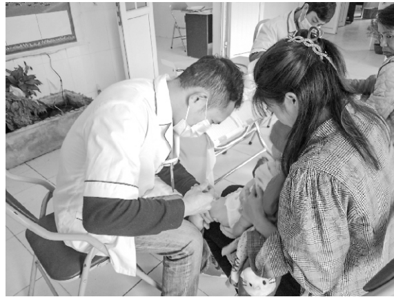
Trạm Y tế Nậm Ban - Nậm Nhùn tiêm vắc xin phòng bệnh cho trẻ em