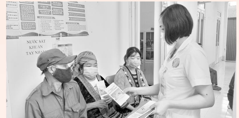
Cán bộ trung tâm Kiểm soát bệnh tật tỉnh phát tờ gấp tuyên truyền PCTHTL cho người dân đến khám bệnh tiểu đường tại Trung tâm

Khi hút thuốc, người hút đưa một lượng carbon dioxin từ khói thuốc vào cơ thể, chất này ngăn cản oxy kết hợp với hồng cầu. Để bù đắp lại, cơ thể tăng sản xuất hồng cầu và đó chính là một trong những tác nhân làm tăng biến chứng suy thận, mù mắt, hoại tử bàn chân, đột quỵ ở bệnh nhân TĐ. Hút thuốc cũng hạn chế tuyến tụy sản xuất insulin và hoạt động điều hòa của insulin, dẫn đến thiếu hụt insulin. Sự thiếu hụt insulin sẽ gây ra bệnh tiểu đường hoặc làm bệnh nặng hơn. Người mắc bệnh TĐ hút thuốc lá có thể gây ra những biến chứng nguy hiểm như: Đau tim, đột quỵ, vấn đề về