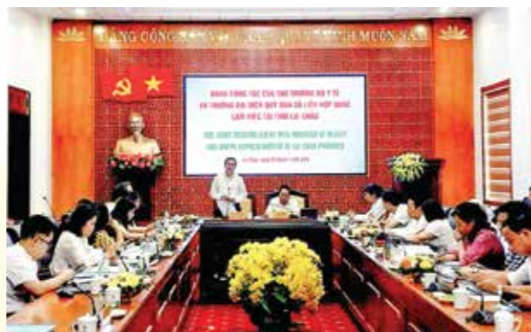
Thứ trưởng Bộ Y tế Trần Văn Thuấn phát biểu tại buổi làm việc với UBND tỉnh