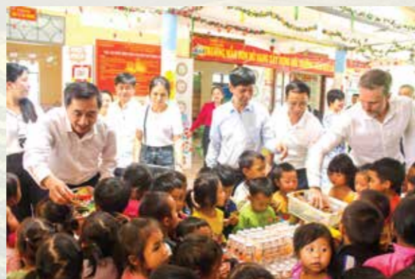
Đoàn công tác Bộ Y tế tặng quà cho các cháu học sinh trường Mầm non Mù Sang