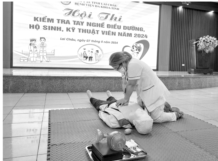
Các thí sinh thi thực hành tại Hội thi

Các thí sinh trải qua phần thi Lý thuyết theo hình thức thi Test gồm 50 câu hỏi trắc nghiệm trong thời gian 60 phút, tổng số điểm tối đa là 100 điểm với những nội dung thiết thực liên quan đến kiến thức chuyên môn, xã hội, chính sách pháp luật, luật khám chữa bệnh, Bảo hiểm xã hội, Quy tắc ứng xử, đạo đức nghề nghiệp. Sau phần thi Lý thuyết, các thí sinh tiếp tục phần thi Thực hành. Các thí sinh được thi theo hình thức bốc thăm chạy trạm, mỗi thí sinh sẽ thực hiện 2 quy trình gồm quy trình vừa bốc được và quy