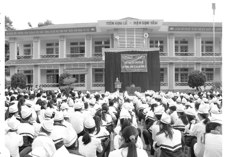
Cán bộ, giáo viên và các em học sinh trường THCS Đoàn Kết thành phố Lai Châu nghe tuyên truyền PCTH Thuốc lá

T hực hiện xây dựng trường học không khói thuốc lá, thời gian qua các trường học trên địa bàn thành phố Lai Châu đã tích cực tuyên truyền bằng nhiều hình thức như: Truyền thông trực tiếp, lồng ghép buổi học ngoại khóa, nói chuyện chuyên đề... Qua đó, bước đầu đã tạo chuyển biến tích cực, làm thay đổi nhận thức, hành động của giáo viên và học sinh về phòng, chống tác hại của thuốc lá (PCTHTL) đối với sức khỏe và môi trường.