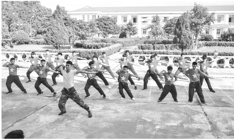
Các em thiếu niên tham gia trải nghiệm Học kỳ quân đội để có kỳ nghỉ hè an toàn và bổ ích

Nạn đuối nước là 1 trong 4 nguyên nhân gây tử vong hàng đầu cho trẻ em. Nguyên nhân dẫn đến một số em bị đuối nước là do các em thường rủ nhau đi tắm sông, suối. Khi tắm ở sông, suối rất nguy hiểm kể cả những em biết bơi, bởi tuổi các em rất hiếu động, các em thường tụ tập trên cao rồi đua nhau nhảy xuống. Khi nhảy từ trên cao xuống thì nguy hiểm nhất là dưới nước có những vật cứng, rồi khi nhảy các em rất dễ bị rơi ngang, bụng tiếp xúc với nước trước với lực rơi rất mạnh dẫn đến tức bụng có khi ngất xỉu tại chỗ. Còn trong lúc đang bơi, các em cũng có thể bị chuột rút cũng