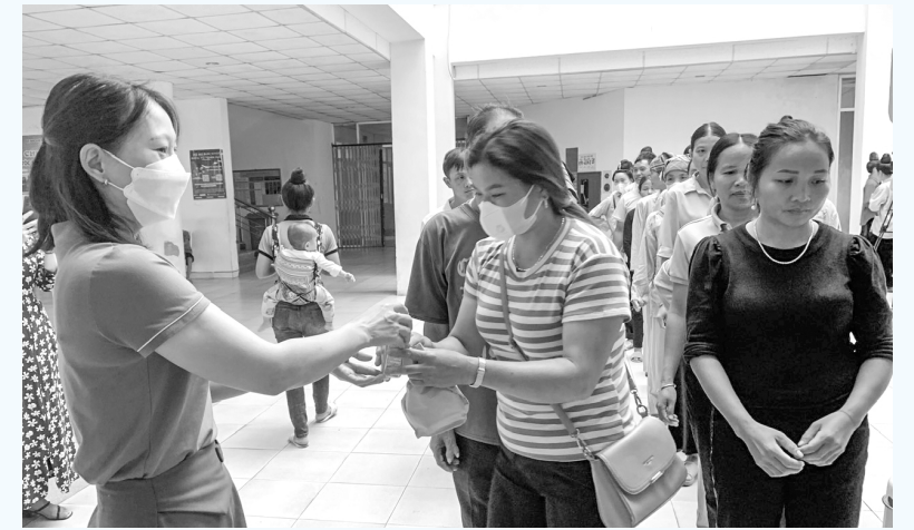
Cán bộ Tổ công tác xã hội phát bánh mì, sữa cho bệnh nhân, người nhà bệnh nhân tại BVĐK tỉnh

Tổ công tác xã hội (CTXH) hiện có 8 cán bộ y tế, thực hiện kiêm nhiệm. Tổ phối hợp với khoa khám bệnh có mặt trước giờ làm việc 20-30 phút để đón tiếp, hướng dẫn người dân đến khám, chữa bệnh. Đồng thời hỗ trợ, hướng dẫn và giải đáp các thắc mắc về thủ tục khám, chữa bệnh bảo đảm quyền lợi cho bệnh nhân và người nhà bệnh nhân. Với sự cảm thông và thấu hiểu người bệnh, nhân viên tổ CTXH luôn lắng nghe và tận tình giải thích tỉ mỉ, động viên để mọi người khi đến đây luôn yên tâm được khám và điều trị. Tổ