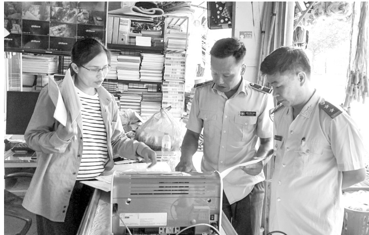
Đoàn kiểm tra liên ngành kiểm tra ATTP tại huyện Sìn Hồ

hiện có 469 cơ sở thực phẩm quản lý. Trong đó, có 14 cơ sở sản xuất, chế biến, 320 cơ sở kinh doanh thực phẩm, 55 cơ sở kinh doanh dịch vụ ăn uống, 26 cơ sở kinh doanh thức ăn đường phố và 54 bếp ăn tập thể. Dưới sự chỉ đạo của Chi cục An toàn vệ sinh thực phẩm tỉnh, nên công tác ATTP trên địa bàn huyện luôn được chú trọng triển khai thực hiện tốt. Đẩy mạnh hoạt động thông tin, truyền thông và đào tạo, tập huấn, nâng cao nhận thức cho cán bộ quản lý, người sản xuất, chế biến, kinh doanh và nhân dân về VSATTP. Chỉ đạo Trung tâm Văn hóa thông tin và truyền thông huyện tăng số lượng tin, bài về công tác đảm bảo an toàn vệ sinh thực phẩm, đưa thông tin về các cơ sở sản xuất lương thực, thực phẩm, rau củ quả an toàn, phối hợp kiểm soát chặt chẽ các nguồn thực phẩm nhập vào địa bàn huyện. Đưa thông tin các cơ sở vi phạm về an toàn thực phẩm lên thông tin đại chúng để cảnh báo tuyên truyền cho người dân phòng và tránh những thực phẩm không đảm bảo về vệ sinh an toàn thực phẩm.