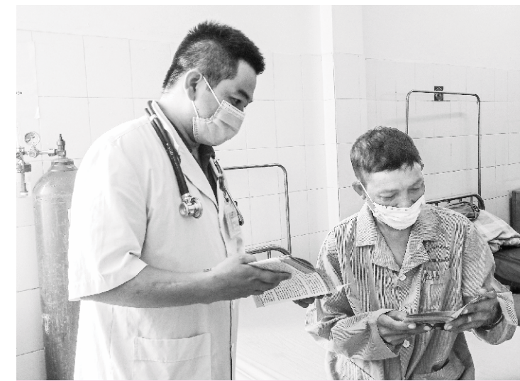
Cán bộ Y tế bệnh viện Phổi tuyên truyền về tác hại của thuốc lá cho bệnh nhân

Là bệnh viện chuyên khoa thực hiện công tác khám chữa bệnh chủ yếu cho người mắc các bệnh liên quan về đường hô hấp, bệnh lao. Vì vậy, việc phòng, chống tác hại của thuốc lá và xây dựng môi trường Bệnh viện không khói thuốc càng trở nên quan trọng và cần thiết. Trước đây, ở Bệnh viện Phổi tỉnh vẫn còn tồn tại tình trạng cán bộ, y bác sỹ hút thuốc lá. Người nhà, người đến thăm bệnh nhân cũng thường xuyên hút thuốc lá tại các phòng bệnh và khuôn viên Bệnh viện. Tuy nhiên, hiện nay môi trường Bệnh viện đã có nhiều thay đổi. Khuôn viên rộng rãi, thoáng mát, đặc biệt tình trạng hút thuốc lá của cán bộ y tế trong khuôn viên Bệnh viện và người nhà, người đến thăm