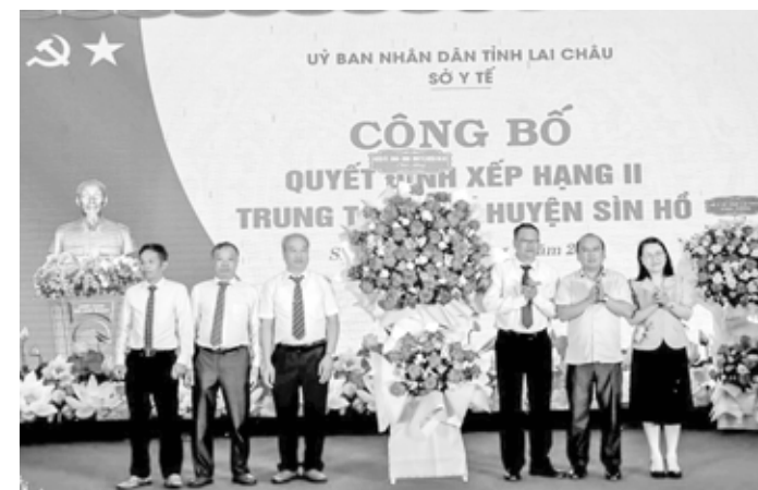
Lãnh đạo Huyện ủy Sìn Hồ chúc mừng TTYT huyện thăng hạng II

Đạt các tiêu chí trung tâm y tế hạng II là quyết tâm và niềm tự hào của những người thầy thuốc ở Sìn Hồ, góp phần nâng cao chất lượng khám chữa bệnh và thực hiện tốt Nghị quyết số 20-NQ/TW của Ban Chấp hành Trung ương về Tăng cường công tác bảo vệ, chăm sóc và nâng cao sức khỏe Nhân dân trong tình hình mới.