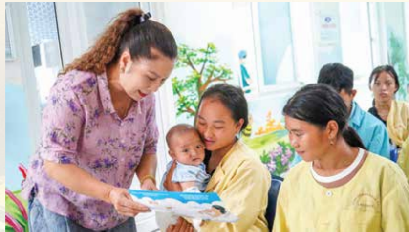
Cán bộ Trung tâm Kiểm soát bệnh tật tỉnh tuyên truyền cho bà mẹ các lợi ích của việc nuôi con bằng sữa mẹ