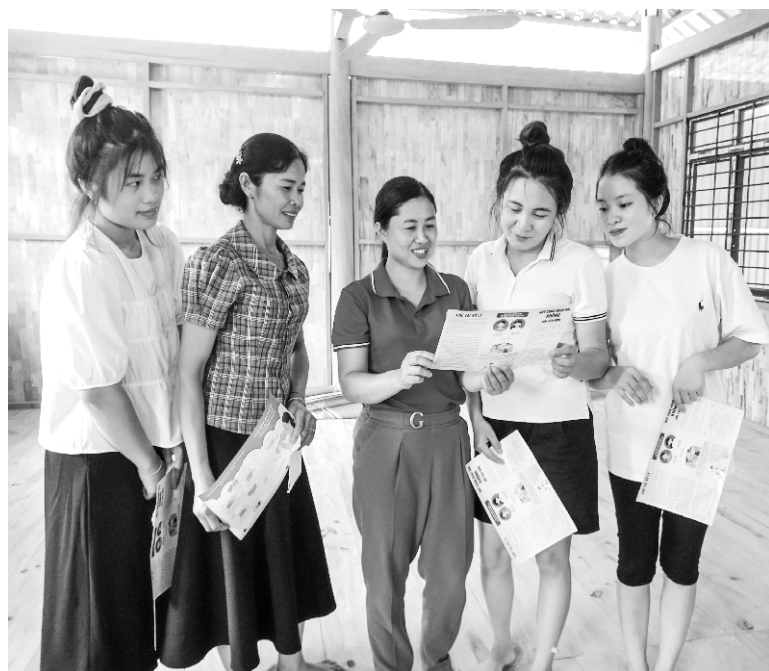
Cán bộ Dân số xã Mường Cang tuyên truyền về chính sách Dân số KHHGĐ cho người dân

M ày 11/7 năm 2024 với 02 chủ đề là “Đầu tư cho công tác dân số là đầu tư cho phát triển bền vững”; “Kỷ niệm 30 năm thực hiện Chương trình Hành động Hội nghị Quốc tế về dân số và phát triển, Cairo 1994” được các địa phương trong tỉnh triển khai tích cực hiệu quả. Cùng với hệ thống dân số trong toàn tỉnh, đội ngũ làm công tác DS - Kế hoạch hóa gia đình (KHHGĐ) trên địa bàn xã Mường Cang (Than Uyên) đã nỗ lực phấn đấu thực hiện, nâng cao chất lượng dân số và chất lượng cuộc sống của người dân, góp phần vào sự phát triển kinh tế, xã hội địa phương.