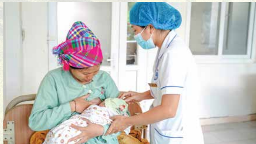
Cán bộ Khoa Phụ Sản (BVĐK tỉnh) hướng dẫn bà mẹ cho con bú đúng cách