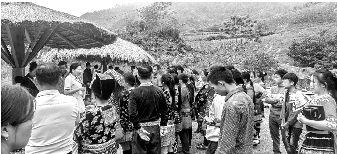
Cán bộ Trạm Y tế xã Trung Chải (Nậm Nhùn) tuyên truyền phòng, chống dịch bệnh cho Nhân dân

C ông tác phòng, chống dịch bệnh được xác định là một nhiệm vụ then chốt để nâng cao chất lượng chăm sóc sức khỏe Nhân dân. Với phương châm “phòng bệnh hơn chữa bệnh”, Trung tâm Y tế huyện Nậm Nhùn luôn bám sát hướng dẫn, chỉ đạo của Sở Y tế về các hoạt động phòng, chống dịch, bảo vệ sức khỏe người dân trên địa bàn huyện ngày một tốt hơn.