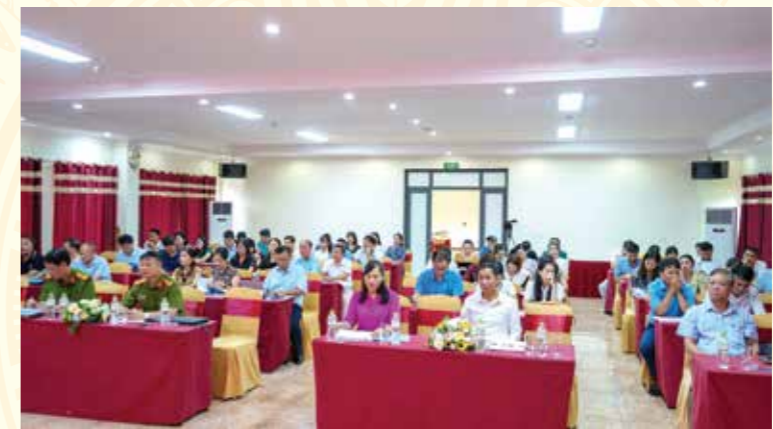
Toàn cảnh Hội nghị Hướng dẫn triển khai Dự án Hỗ trợ kỹ thuật Quỹ toàn cầu phòng, chống HIV/AIDS năm 2024