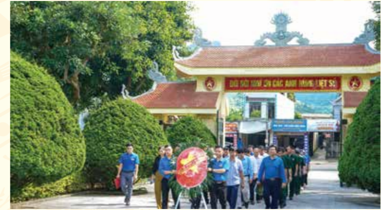
Đoàn Sở Y tế dâng hoa tại đài tưởng niệm các anh hùng liệt sĩ nhân ngày Thương binh - liệt sĩ 27/7