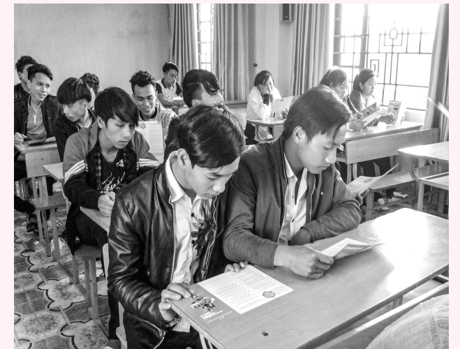
Học sinh Trung tâm giáo dục thường xuyên - Hướng nghiệp tỉnh đang tìm hiểu tài liệu về Chăm sóc sức khỏe sinh sản vị thành niên

Hiện nay, nhiều bậc cha mẹ vẫn còn cho rằng giáo dục giới tính là chuyện tế nhị, đến tuổi thì con tự biết. Quan hệ lỏng lẻo giữa cha mẹ và con cái dẫn đến các em có mối quan hệ yêu đương sớm trong khi nhận thức về giáo dục giới tính chưa đầy đủ. Nhiều bậc cha mẹ vẫn tồn tại những suy nghĩ phong kiến như trao đổi, cung cấp cho trẻ những kiến thức về giới tính là “vẽ đường cho hươu chạy”. Vì thế họ không bao giờ trao đổi với các em về những vấn đề này. Từ đó, không ít phụ huynh đã “giáo dục” con bằng cách nhốt lại hay đòn roi khi biết con yêu sớm. Có ông bố đã sử dụng vũ lực khi biết con yêu sớm rồi đánh con nát cả cây roi. Có bà mẹ ép buộc con gái phải dẫn mình đến nhà người yêu để “chửi cho cả nhà thằng đó một trận”... Nhưng rồi hậu quả để lại chỉ là con cái họ khủng hoảng hơn mà thôi. Bởi trong hoàn cảnh nền kinh tế thị trường