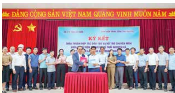
Ký kết Thỏa thuận hợp tác đào tạo và hỗ trợ chuyên môn giữa bệnh viện Trung ương Thái Nguyên và Sở Y tế Lai Châu giai đoạn 2024 - 2026