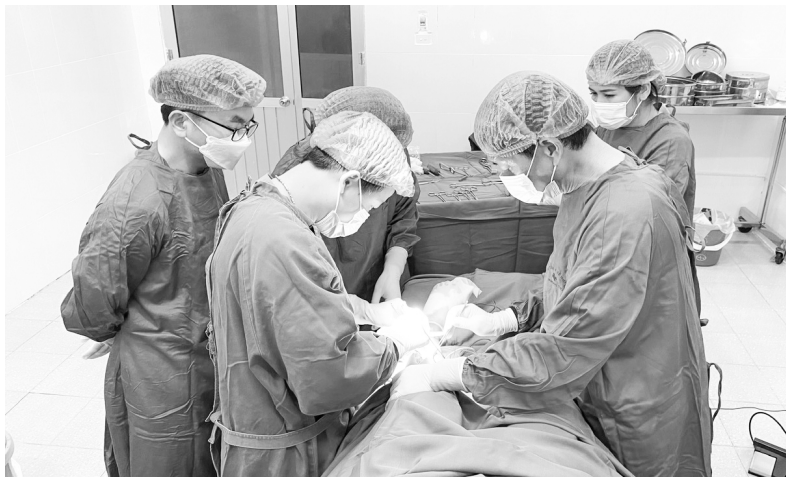
Các bác sĩ của Bệnh viện E Hà Nội thực hiện ca mổ chuyển giao kỹ thuật cho trung tâm y tế huyện Phong Thổ

Đến TTYT huyện Phong Thổ hôm nay rất dễ để nhận thấy sự đổi mới. Cơ sở vật chất được đầu tư khang trang, rộng rãi, cảnh quan sạch đẹp. Hệ thống