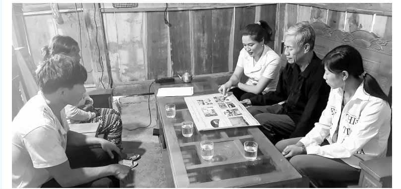
Cán bộ Trạm Y tế xã Pa Ủ tuyên truyền về phòng chống sốt rét tại hộ gia đình cho người dân

Được sự quan tâm, chỉ đạo của Tỉnh ủy, HĐND, UBND tỉnh, của Sở Y tế, sự phối kết hợp và vào cuộc của các cấp, các Ngành, chính quyền địa phương trong hoạt động phòng, chống và loại trừ sốt rét. Được sự giúp đỡ của Viện sốt rét - Ký sinh trùng - Côn trùng Trung ương và chỉ đạo của Ban giám đốc Trung tâm Kiểm soát bệnh tật tỉnh. Hoạt động của Dự án Sáng kiến ngăn chặn và loại trừ sốt rét kháng Artemisinin (RAI3E), các tổ chức HPA, PATH, WHO... đã hỗ trợ thuốc, hóa chất, vật tư và