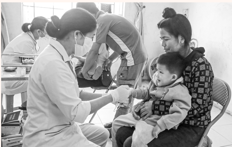
Điều trị cho bệnh nhân nhi tại TTYT Sìn Hồ cơ sở 2

Trung tâm được xây dựng có đầy đủ các khoa lâm sàng và phòng chức năng, với quy mô 100 giường bệnh, chữa bệnh. Chất lượng khám, chữa bệnh được nâng lên thông qua quy hoạch đào tạo, đào tạo lại về chuyên môn, quy trình khám, chữa bệnh được cải tiến, rút ngắn thời gian chờ đợi của người bệnh. Tinh thần và thái độ phục vụ