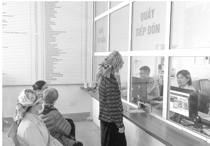
Khi người dân tham gia BHYT đủ 5 năm sẽ được hưởng những quyền lợi vô cùng đặc biệt

Như vậy, BHYT 5 năm liên tục là khi một người có thời gian tham gia BHYT 5 năm liên tục